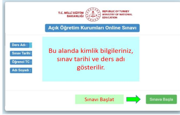
Resim-4 : "Online Sınav Başlatma Ekranı"